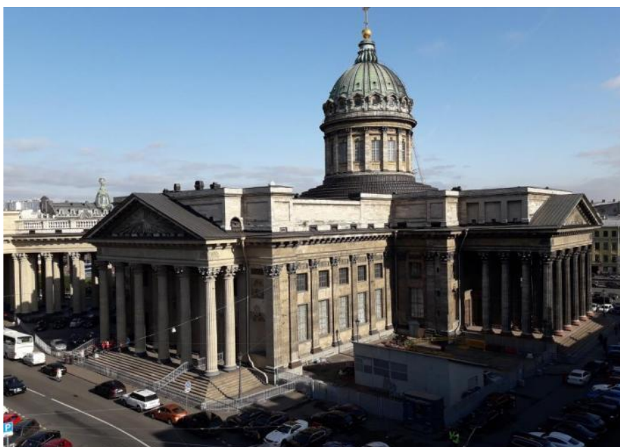
Fot. 3. Sobór Ikony Matki Bożej Kazańskiej w Sankt Petersburgu, 1801-1811, architekt Andrej Woronichin.

(od strony Newskiego Prospektu).