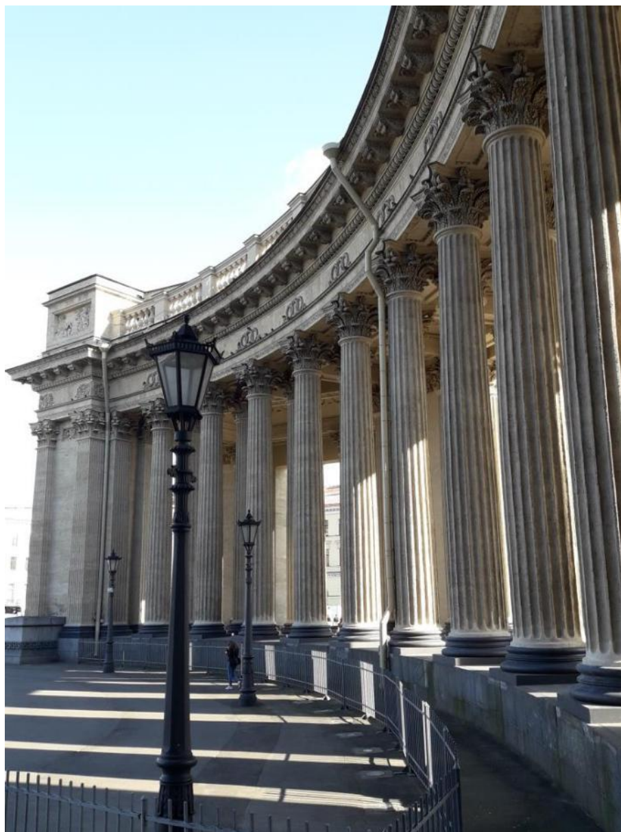
Fot. 4. Sobór Ikony Matki Bożej Kazańskiej w Sankt Petersburgu, 1801-1811. Kolumnada, architekt Andrej Woronichin.