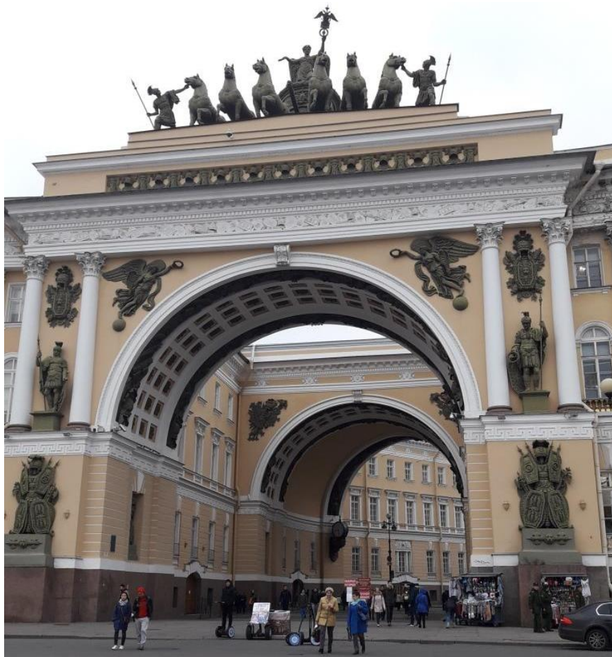
Fot. 10. Budynek Sztabu Głównego, 1819-1829, architekt Carlo Rossi.