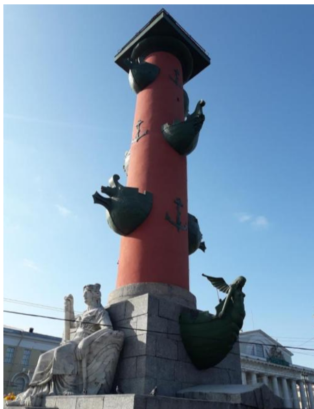
Fot. 6. Kolumna rostralna, architekt Jean-Francois Thomas de Thomon. Autor zdjęcia: Witalij Bohatyrewicz, 2018.

Autor zdjęcia: Witalij Bohatyrewicz, 2018.