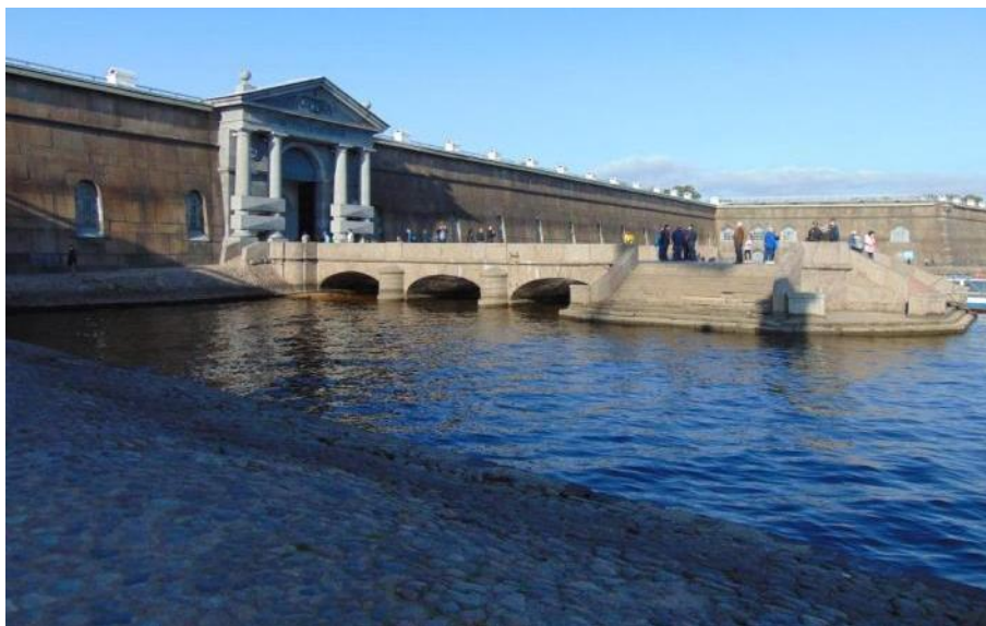
Fot. 1. Newskie Wrota Twierdzy Pietropawłowskiej, 1787, architekt Nikolaj Lwow.

Twórczość Nikolaja Lwowa (1751-1803), która przypada na okres dojrzałego klasycyzmu, czyli na lata 80. i 90. XIX w., charakteryzuje się obfitym stosowaniem portyków, kolumn, pilastrów oraz innych elementów cechujących architekturę klasycystyczną. Zrobił on wspaniałą karierę zarówno w Petersburgu, jak i w pobliskich miejscowościach. Do jednych z najlepszych dzieł Lwowa należą również Newskie Wrota Twierdzy Pietropawłowskiej (Анисимов, 2016, 363-365), które zostały zaprojektowane w 1780 r., a zrealizowane w latach 1784-1787. Było to zadanie niezwykle trudne do wykonania, ponieważ należało wkomponować Newskie Wrota pomiędzy istniejącymi już bastionami Piotra Wielkiego i Naryszkina. Dokonać tego należało w taki sposób, aby struktura architektoniczna nowo powstałego dzieła była czytelna na tle kamiennych ścian otaczających twierdzę. Lwow poradził sobie z tym zadaniem znakomicie, tworząc wrota w postaci monumentalnego — wykraczającego za linię ścian — portyku kolumnowego (Шуйский, 1997b, 84-87). Portyk ten składa się z czterech kolumn w porządku toskańskim, które zostały umieszczone parami po bokach arkady wejściowej i spoczywają na masywnych cokołach. Całość kompozycji została tradycyjnie zwieńczona trójkątnym szczytem.