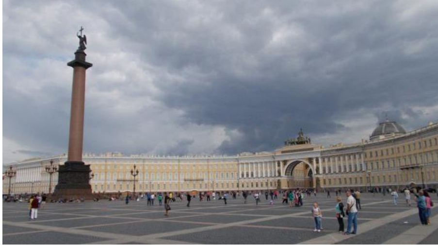
Fot. 9. Budynek Sztabu Głównego, 1819-1829, architekt Carlo Rossi.

Kolejnym dziełem Carla Rossiego jest budynek Sztabu Głównego, zrealizowany w latach 1819-1829. Architekt wykorzystał częściowo gmachy, które wykonał Yury Felten. Rossi zachował ściany tych budowli, a w niektórych przypadkach nawet fragmenty wnętrz (Кириков, 2007, 201-204). W tym przykładzie widzimy ponownie połączenie architektury z rzeźbą monumentalną.