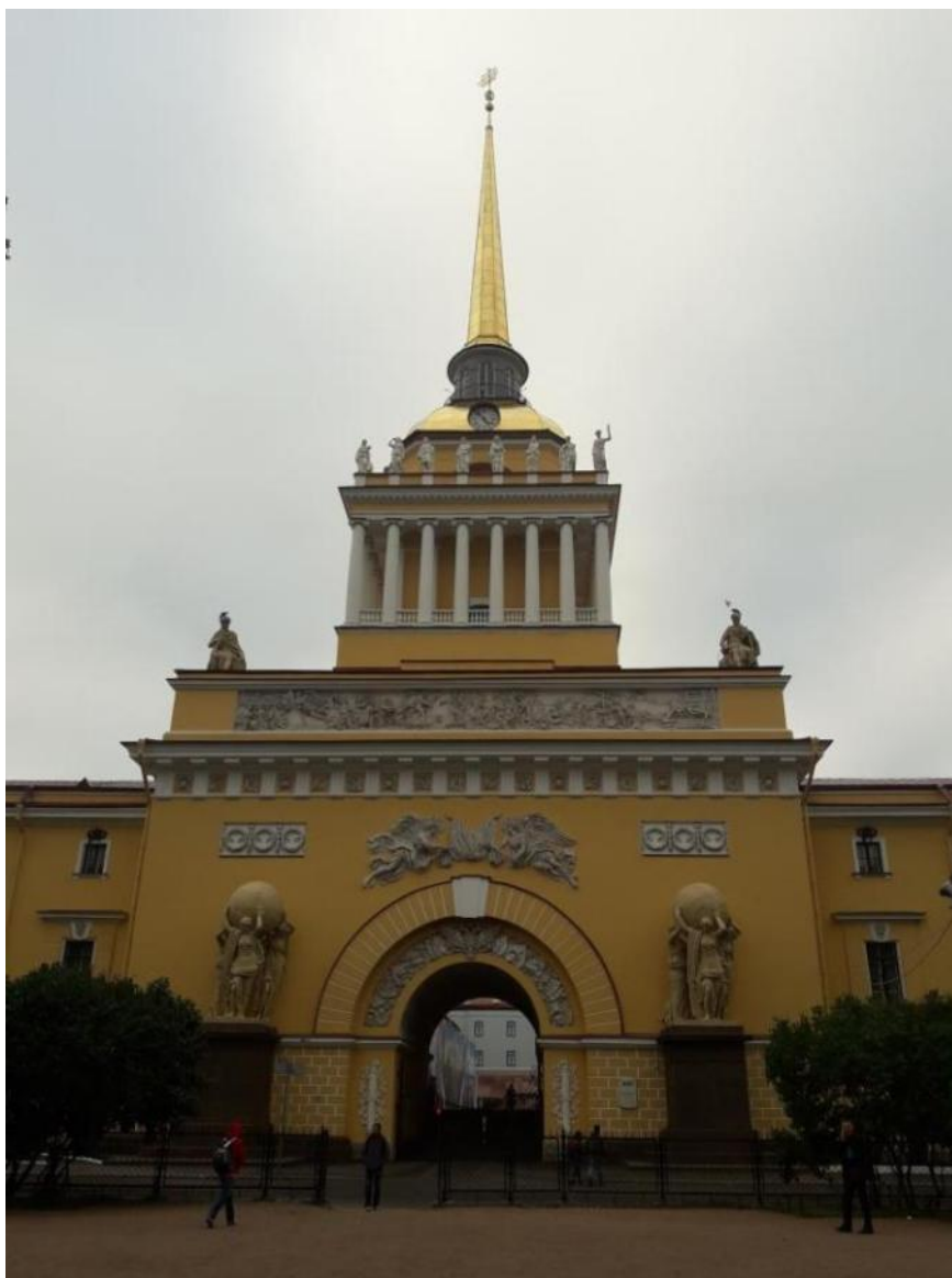
Fot. 8. Admiralicja, 1806-1819, architekt Andrejan Zacharow.

Należy podkreślić, że późny klasycyzm miał istotne znaczenie dla całej architektury, zarówno na gruncie rosyjskim, jak i innych krajów i wywarł wpływ także na budowle sakralne, których przykłady widoczne są i w Polsce. Jednym z przykładów jest cerkiew św. Mikołaja w Białymstoku (Робиннов, 2011, 372-376).