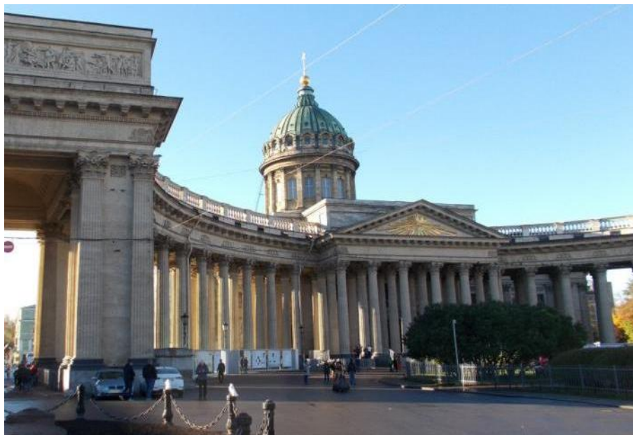
Fot. 2. Sobór Ikony Matki Bożej Kazańskiej w Sankt Petersburgu, 1801-1811, architekt Andrej Woronichin.

św. Piotra utrzymana została w porządku tokańskim, a Woronichina występuje w postaci 72 stylizowanych porządków o kapitelach korynckich.