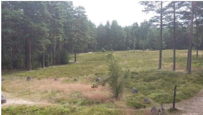
Fot. 4. Rezerwat Przyrody Kamienne Kręgi w Odrach.

da — odnajduje się w ich obrębie pozostałości świadczące o złożeniu tam szczątków ludzkich. Pewną rolę odgrywa tu także bliskość cieków wodnych, gdyż najważniejsze tego typu obiekty zlokalizowane są nieopodal rzek. Czy chodziło tu pragmatycznie o formę komunikacji, jako najlepszą drogę dotarcia do tych miejsc, czy też element rytuału przejścia tudzież oczyszczenia (rytualna ablucja) poprzez obmycie się w wodach płynących, stanowi nieodłączny element dyskursu naukowego (Piętkowski, 2017, 119-120). Swoją drogą musi być ciekawe, że łądołów, Goci, a także wyżej wspomniani Wikingowie, przybywają na Pomorze z półwyspu skandynawskiego.