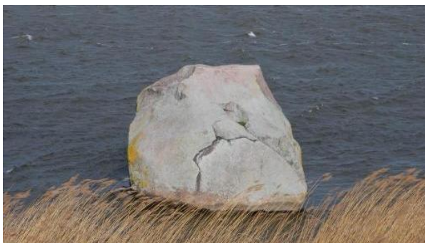
Fot. 1. Głaz Królewski w Kamieniu Pomorskim (Wyspa Chrzążczewska).