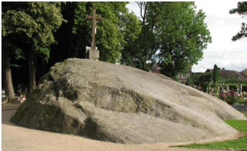
Fot. 2. Głaz Trzyglaw w Tychowie.