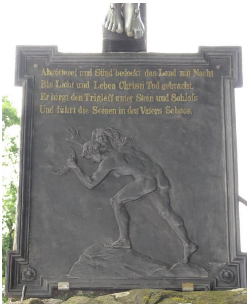
Fot. 3.1. Tablica umieszczona na Głazie Tryglawa.

Nazwa tego głazu narzutowego wskazuje także, że nadano mu też miejsce w budowie lokalnej tradycji kultu świętego Ottona (pogański kult Tryglawa jest opisany w żywotach tegoż świętego), gdyż ostatnią stacją na drodze powrotnej biskupa bamberskiego powracającego z Pomorza, podczas pierwszej wyprawy misyjnej, był pobliski Białogard (Rosik, 2010, 335-340. O kulcie biskupa Ottona na przestrzeni wieków zob. Wejman, 2018, 277-295). Żywa pamięć tamtejszej społeczności o tym autentycznym wydarzeniu, podtrzymywana zapewne przez miejscowych kaznodziejów, wynalazła jednak z czasem kolejny przystanek na trasie marszruty biskupiego orszaku. Co warto podkreślić tu też jego pochodzenie w świetle jednej z legend przypisuje się diabłu, który chcąc zniszczyć kościół w Tychowie miał nieudolnie cisnąć ten głaz ze Skandynawii (legendę w całości przytacza Łysiak, 1998).