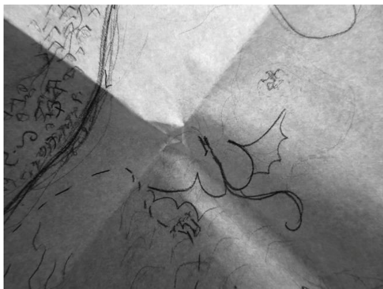
Mapa 2. Jaśmina Morawiecka, Widnokrąg