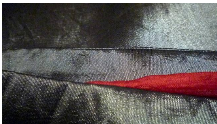
Mapa 3. Maria Morawicka, Impresja. Wschód słońca